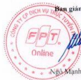
Ngô Mạnh Cường