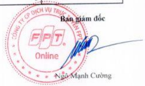
Ngô Mạnh Cường