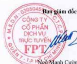
Ngô Mạnh Cường